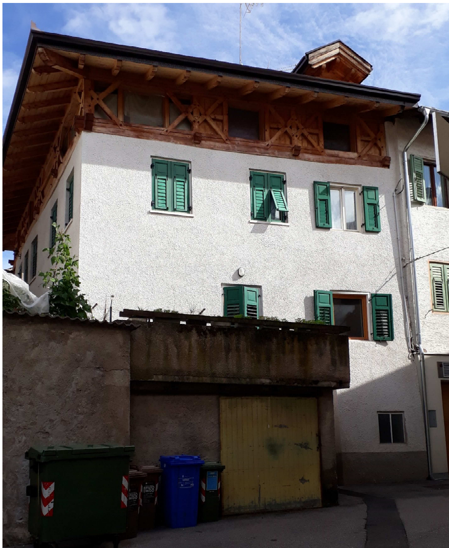
Vista da sud